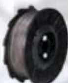
TW897-EG Filo zincato