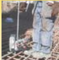
Prolunga dell'impugnatura (Optional)

Sia l'Istituto Nazionale sulla Sicurezza sul lavoro e l'Associazione sulla sicurezza della salute dell'Ontario dichiarano che le legatrici MAX riducono i rischi della Sindrome del Tunnel Carpale e altri problemi muscoloscheletrici.