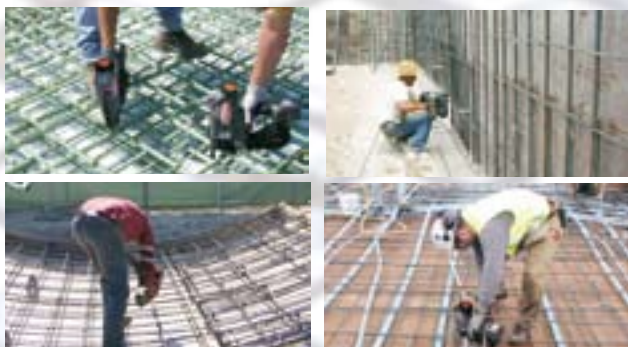
EDIFICI COMMERCIALI/ FONDAMENTA/ COSTRUZIONI DI STRADE / PONTI/ EDIFICI PREFABBRICATI / TUBI DI IRRADIAMENTO DI CALORE