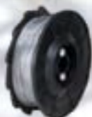
TW897 Filo in acciaio