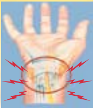
Sindrome del tunnel carpale

Tirando solamente il grilletto si riducono i danni potenziali al polso come la sindrome del tunnel carpale e utilizzando la prolunga (optional) si riduce il rischio di danni alla schiena.