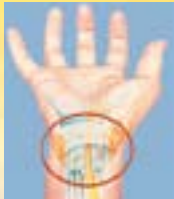
Sindrome del tunnel carpale

Tirando solamente il grilletto si riducono i danni potenziali al polso come la sindrome del tunnel carpale e utilizzando la prolunga (optional) si riduce il rischio di danni alla schiena.