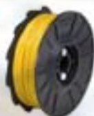
TW897-PC Filo ricoperto in poliestere